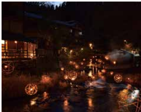
黒川温泉の湯灯り