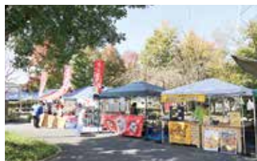
約10店舗の屋台やキッチンカーにお越しいただきました