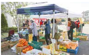
大好評だった野菜の詰め放題