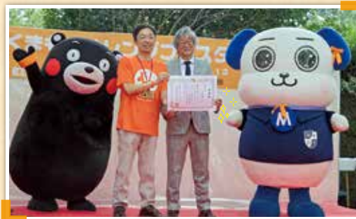
犬飼会長が代表して県知事より表彰を受けました。