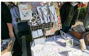
ましきの風ミニマルシェも開催