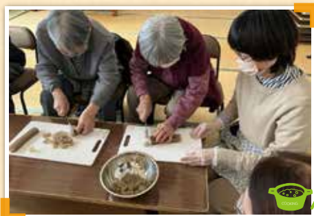
下砥川でのおばあちゃんの料理教室。毎回おふくろの味を教えてもらっています。