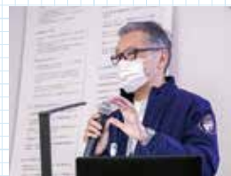
犬飼会長による特別講演