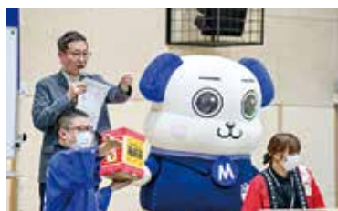
毎年大人気の抽選会 ましまるもお手伝いしました