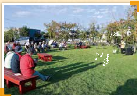
夕暮れサロン。年4回開催し、この日は芝生広場で益城町消防音楽隊による演奏を楽しみました。

益城病院では、2016年の熊本地震以降、町内3カ所（福富・下砥川・市の後）で認知症カフェ「オレンジサロンいきいきカフェ」を開催しています。この取り組みは、“認知症になっても安心して暮らせる”ことを目標に、認知症の人やその家族、また高齢の方々が参加することで、地域社会からの孤立を防ぐことを目的としています。福富地区のオレンジサロンは一昨年度より、下砥川地区のオレンジサロンは本年度から、「チームオレンジ」として活動を強化しています。