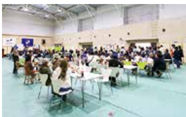
会場の体育館では食事を楽しみながらステージをご覧になる方々でいっぱいでした