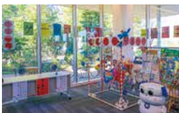
職員手作りの千本つりは子どもたちに好評でした