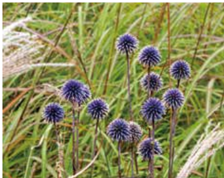
タデ原湿原の秋景色

今年の春から始まった地域移行支援施設「ましき童夢」の工事が終わりを迎え、全貌を現しました。私自身、どんなものが出来るのかと期待もあり、通勤中に眺めていました。いざ完成した姿に驚くと同時に、ワクワクが止まりません。地域の方々と共に新しい支援の数々にトライできる場所として作り上げていきたいと思えます。