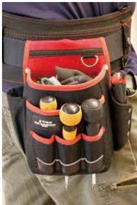
すぐに対応するために ホルスターを常時装着