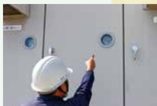
屋上に上がって配電盤点検