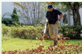
院庭景観を保つため 定期的な落ち葉集め