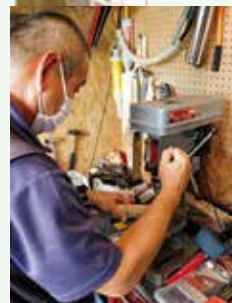
機械を自在に操り様々な ことに自力で対応

グリーンキーパーとして、院庭の管理を担当しています。樹木・芝生・草花のメンテナンスを行うことで、心地よい空間を提供しています。美しい景観を保つことで、患者さんや近隣住民に癒しと安らぎを与え、人々の心に寄り添い、快適な滞在を支えています。