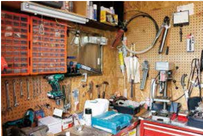
あらゆる作業に対応するための工具類