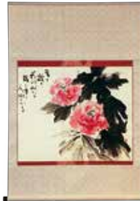
緋牡丹 (春山千艸先生)